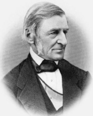
RALPH WALDO EMERSON

"It's not the destination, it's the journey."